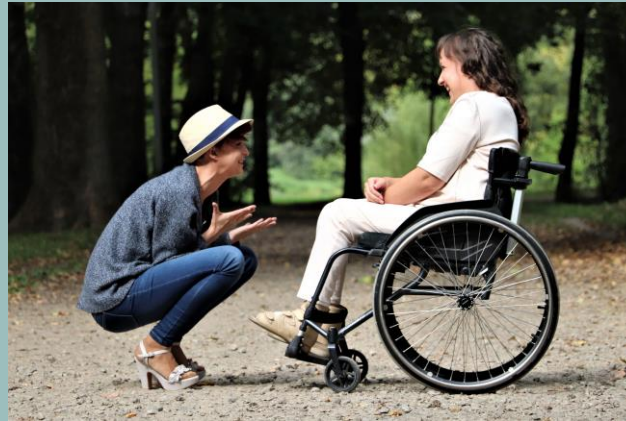
D'une personne porteuse d'un handicap