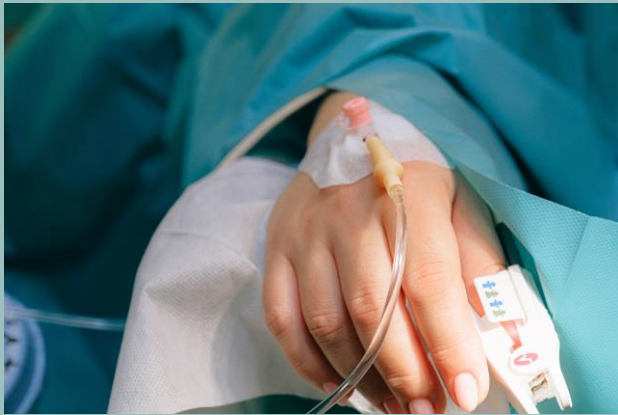
D'une personne malade